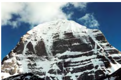
Северная, почти отвесная, стена Кайласа.

Разглядеть снимки детально можно, увеличив масштаб отображения документа до 317%.