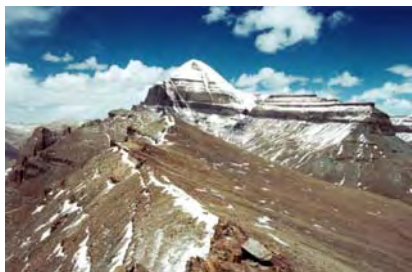
Соседствующий с Кайласом слоистый гребень (на фото справа от вершины) обычно «не попадает» в кадр у тех, кто пытаются навязать миф о «Кайласе-пирамиде».