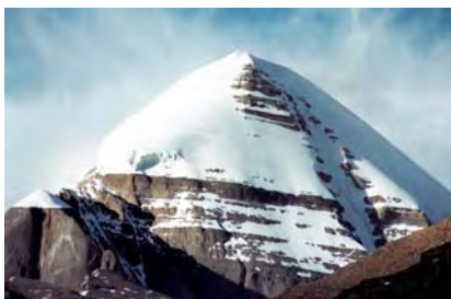
Вершина Кайласа, которую уже принято считать рукотворной пирамидой. Хорошо видна слоистая скальная порода.