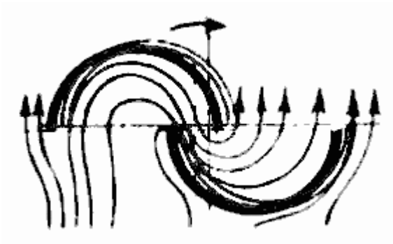
Рис. 2. Схема работы роторного ветродвигателя.